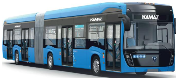
Электробус особо большого класса КАМАЗ-6292

Пассажировместимость – 135 чел. Мест для сидения - 42 (+1) Ультрабыстрая зарядка – 10-20 мин. Запас хода - 90 км