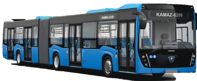
Автобус особо большого класса КАМАЗ-6299 КПК/ДТ

Пассажировместимость – 146...162 чел. Мест для сидения - 44 (+1)